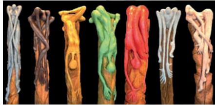
Sandrine Boutté - Sculptures