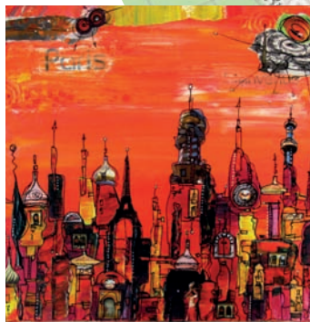
Azoline, Soir de braise - Peinture, collage et dessin