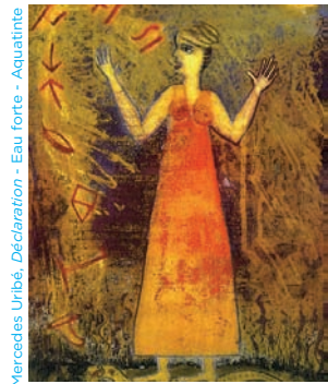
Mercedes Uribe, Déclaration - Eau forte - Aquarelle

Participe à un atelier de gravure (samedi et dimanche à 14h à partir de 6 ans sur réservation : contact@lamerceurie-agence.com) ou par ordre d'arrivée, dans la limite des places disponibles. Tu repartiras avec ton tirage !