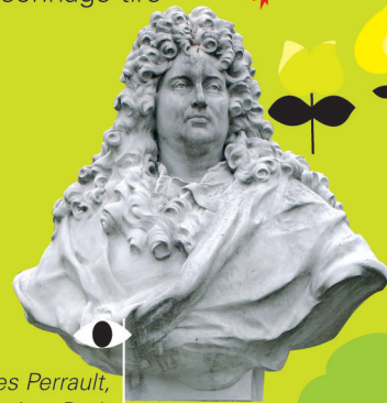
Monument à Charles Perrault, de Gabriel Edouard Baptiste Pech