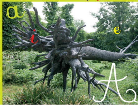
Arbre aux voyelles, de Giuseppe Penone

3. Cet arbre déraciné est une sculpture de bronze. Fais-en le tour et observe comme ses branches sont proches des arbustes plantés tout près. Le faux arbre se mêle à la vraie végétation. Ses racines dessinent des voyelles. Amuse-toi à les retrouver.