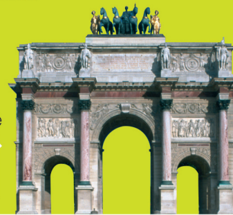
L'arc de triomphe du Carrousel