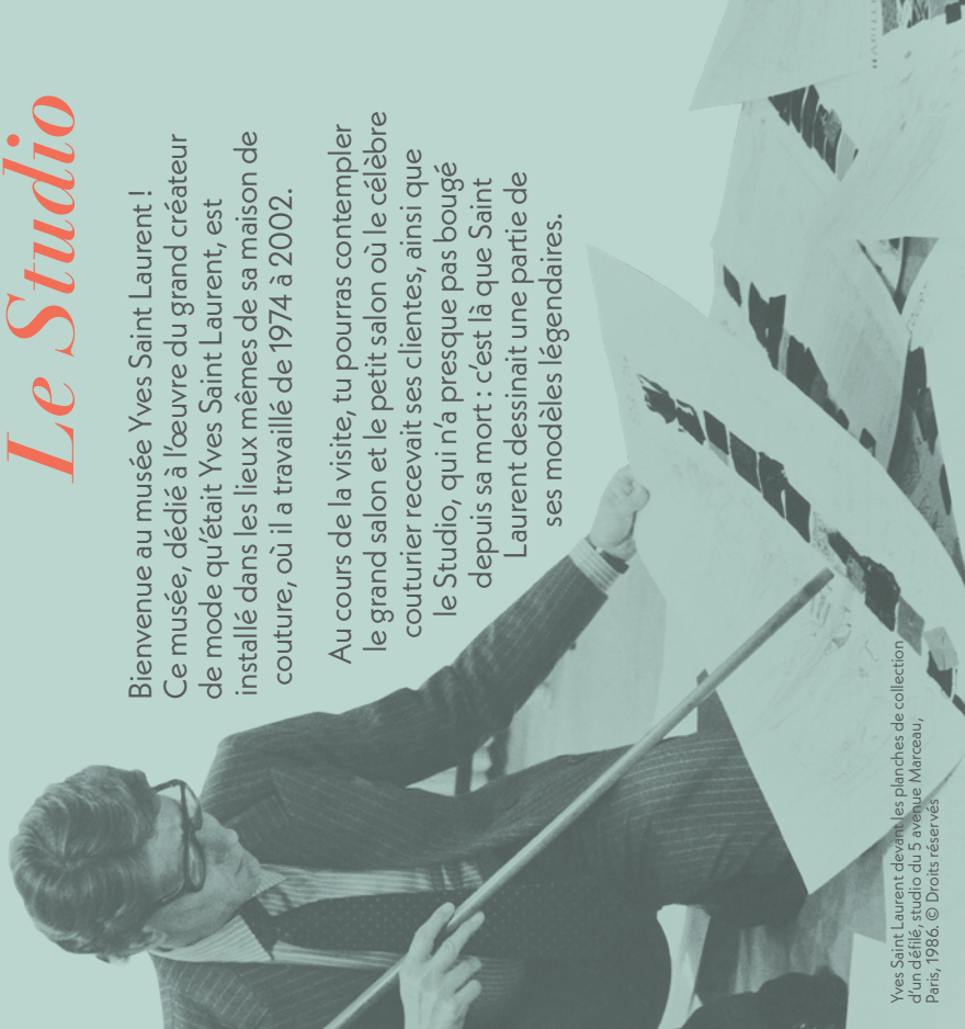
Yves Saint Laurent devant les planches de collection d'un défilé, studio du 5 avenue Marceau, Paris, 1986.

Au cours de la visite, tu pourras contempler le grand salon et le petit salon où le célèbre couturier recevait ses clientes, ainsi que le Studio, qui n'a presque pas bougé depuis sa mort : c'est là que Saint Laurent dessinait une partie de ses modèles légendaires.