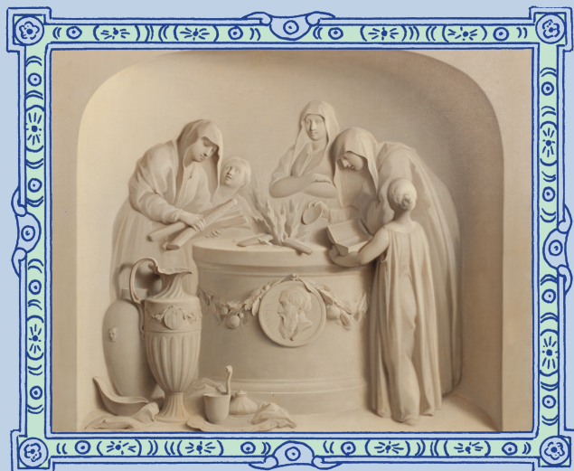
Les Vestales, Jacob de Wit

Cinq erreurs se sont glissées entre ces deux images, débúsque-les !