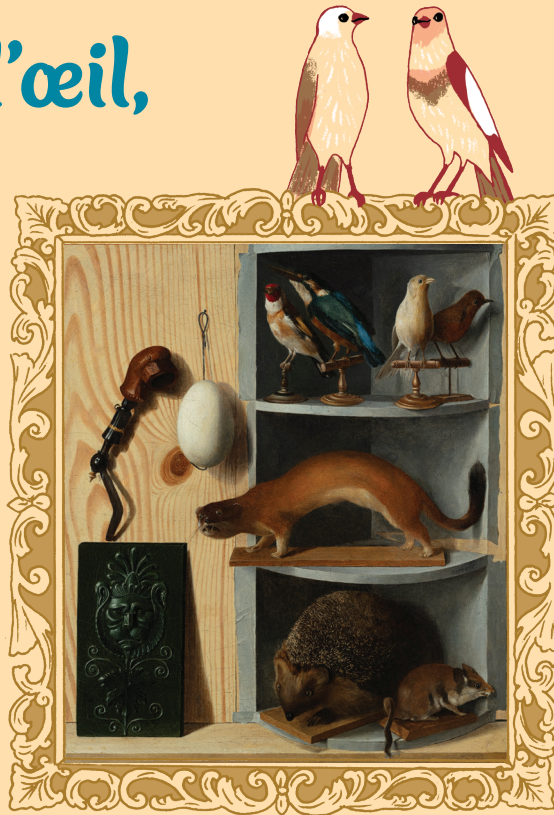
Trompe-l'œil figurant des animaux, un œuf et un bas-relief, Gabriel Germain Joncherie