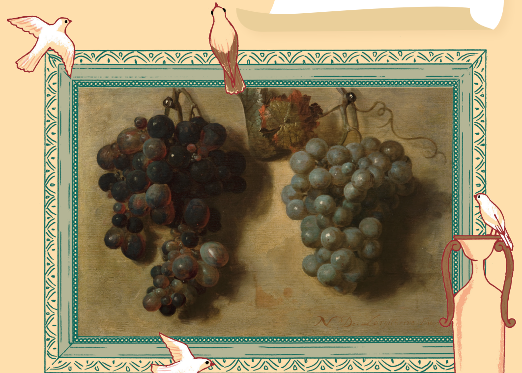
Deux grappes de raisin, Nicolas de Largillière

Zeuxis, tout fier de la sentence des ....., demande qu'on tirât enfin le ..... pour faire voir le ..... . Alors, reconnaissant son ....., il s'avoua vaincu.