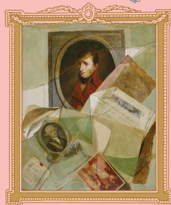
Trompe-l'œil, dit aussi Traité de paix définitif entre la France et l'Espagne , Laurent Dabos