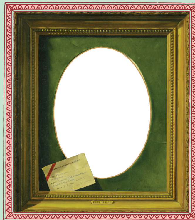
Tableau en déplacement, Pierre Ducordeau