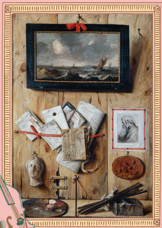
Trompe-l'oeil, Jean-François de Le Motte

Un seul de ces détails n'appartient pas au tableau ci-contre, lequel ?