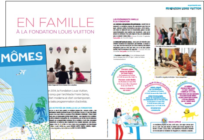
Visuel de 4 e de couverture créé par Paris Mômes.